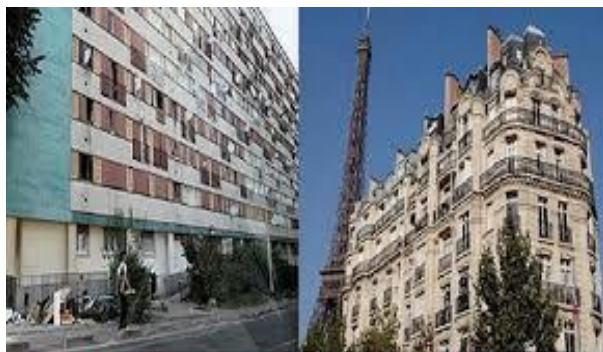
Immeuble banlieue Paris